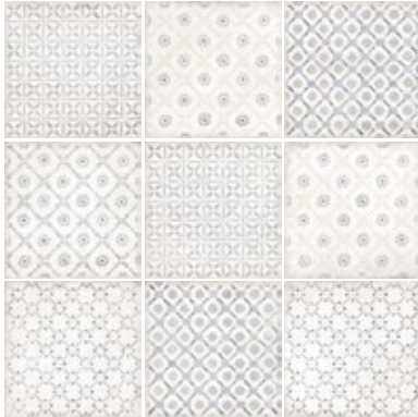
SPRING COOL GREY 24144 EQ-10D