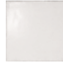
OLD WHITE 24096 EQ-3