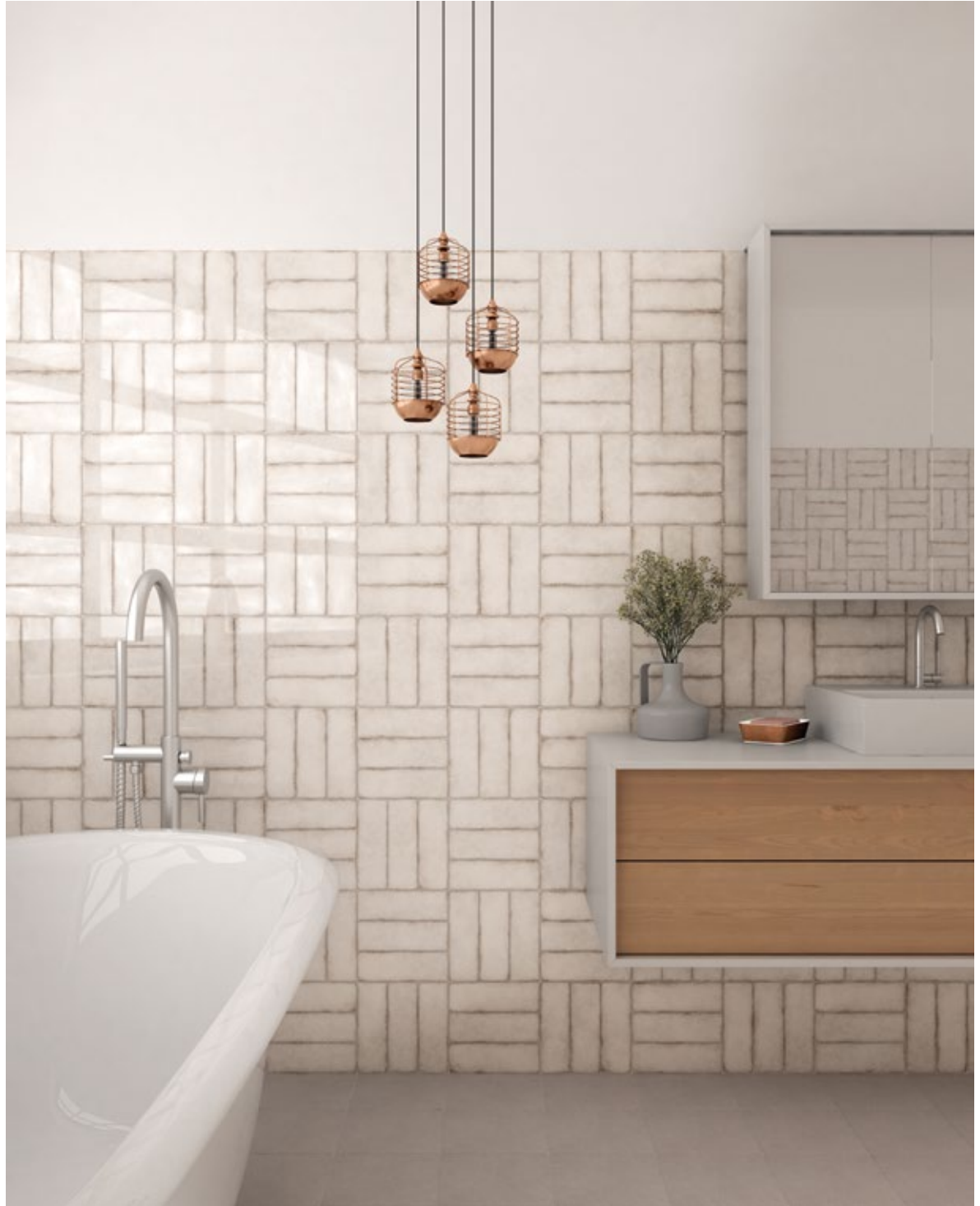
^ Vestige Gesso 6,5 x 20 cm / 2 1/2" x 8"