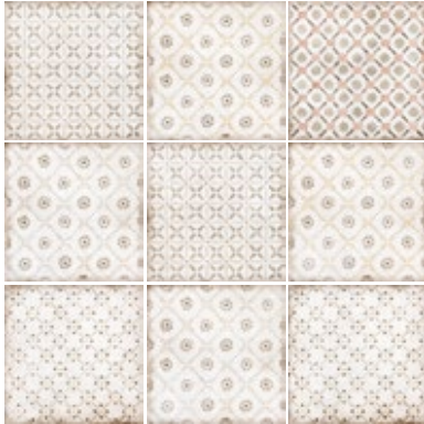
SPRING LIGHT UMBER 24145 EQ-10D