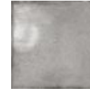
COOL GREY 24099 EQ-3