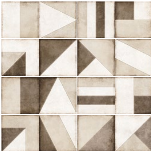
TANGRAM LIGHT UMBER 24143 EQ-10D