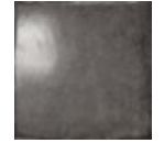
HAT BLACK 24100 EQ-3