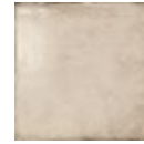
LIGHT UMBER 24098 EQ-3