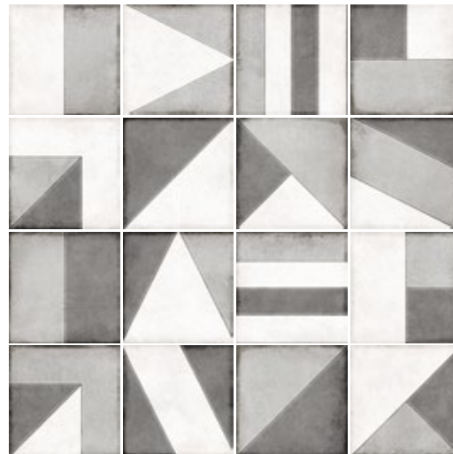
TANGRAM COOL GREY 24142 EQ-10D