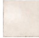
GESO 24097 EQ-3